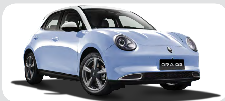
Azul / Blanco