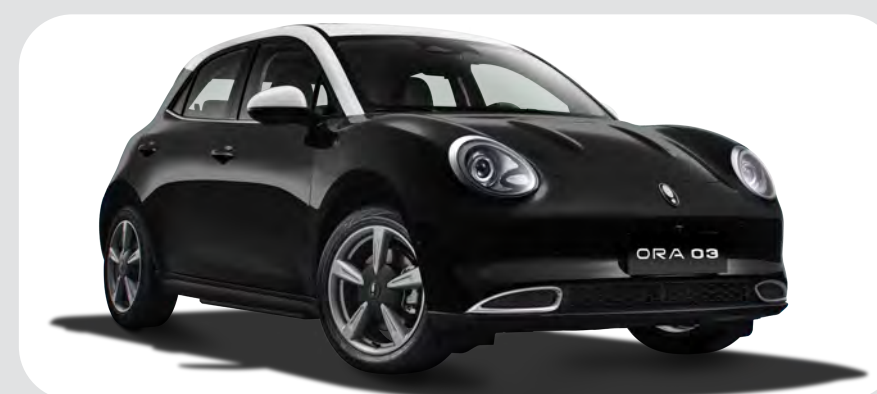
Negro / Blanco