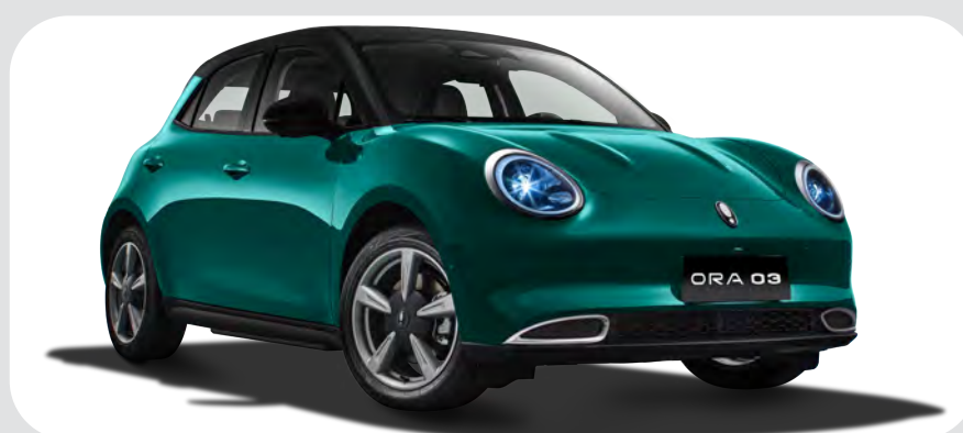
Verde / Negro