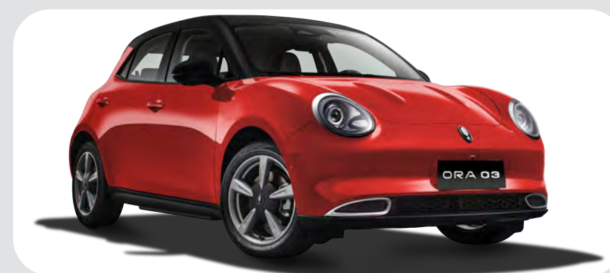
Rojo / Negro