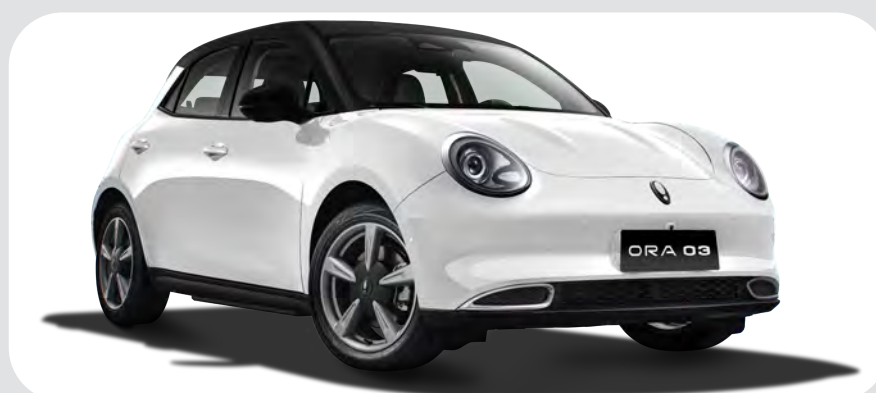
Blanco / Negro